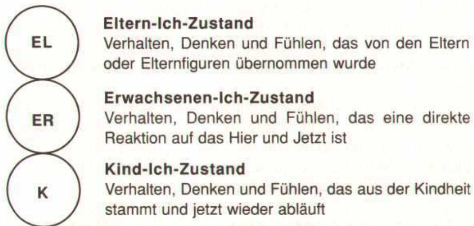
Abbildung 2.1: Strukturdiagramm erster Ordnung: Das Ich-Zustands-Modell